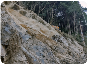
大柳高瀬線の崩土

問 町道大柳高瀬線道路 災害復旧工事において、 法面8分勾配を1割に 変更、600万円追加 しているが当初段階で 見積もれなかったのか。 積算基準をどういう 形でされたのかお聞き したい。 答 契約後立木の伐採を おこない、現場状況を 確認していく中で、8 分勾配では残った土砂 の塊まりなどが崩落す る可能性があるかと判断 した。 1割勾配の切土で施 工するように変更する ための増額である。