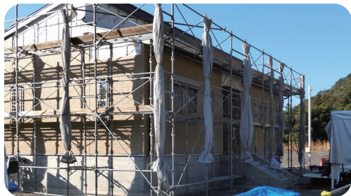
建設中の医師住宅