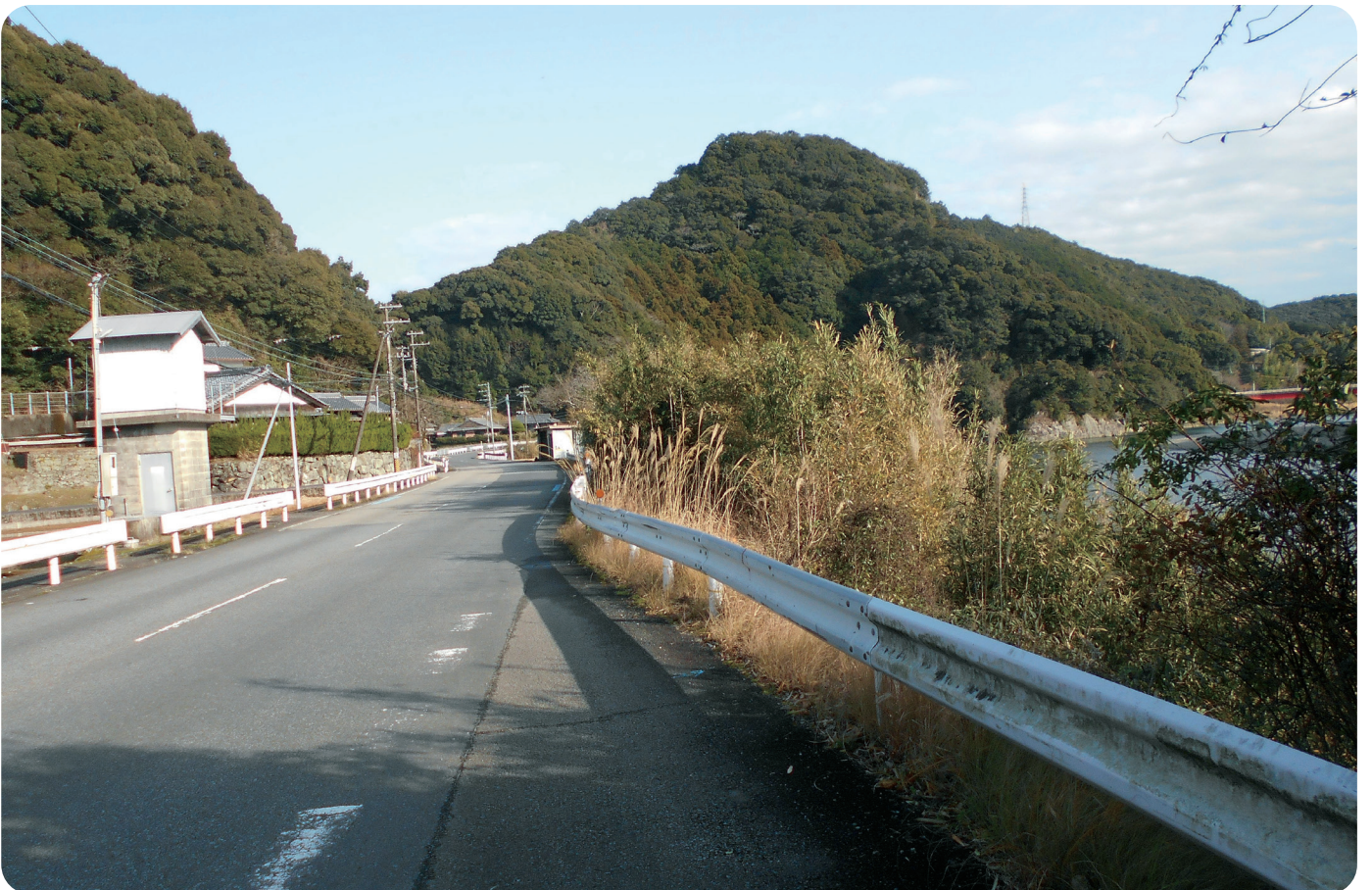
宇津木地区水道施設