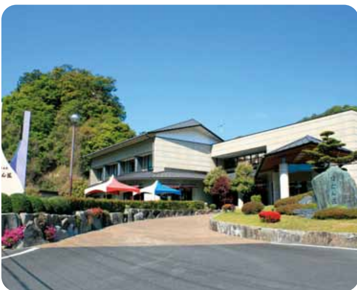
月野瀬温泉 ぼたん荘