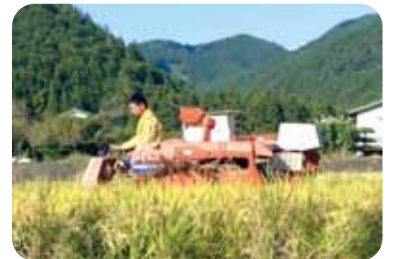
休耕田を復活希望の若者