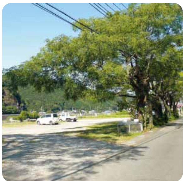
太陽光発電設置予定地（高池）

購入年月や設置場所、状況写真等、台帳整備をしているが、過去に整備したものは経過年数など把握が出来ていないのが現状。本年度は消防団幹部会において状況報告。まず事務局において既に設置のホースについて、台帳整備をおこなうことを確認している。