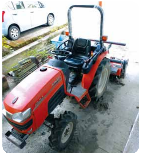
貸し出し用トラクター

大きな工事は1月19日まで工期を延ばして、随時契約工事については、3月26日まで工期を延ばしている。