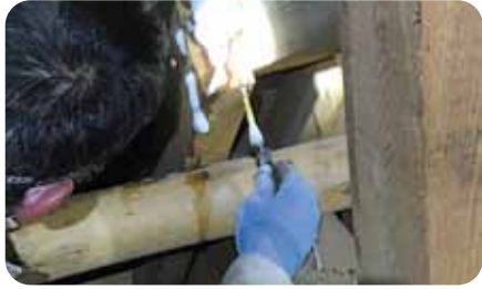
アメリカカンザイシロアリ薬剤注入

前年度に比べて売り上げが下がった人が対象であったが、今回は収入が下がった。効果は2年から3年と聞いている。