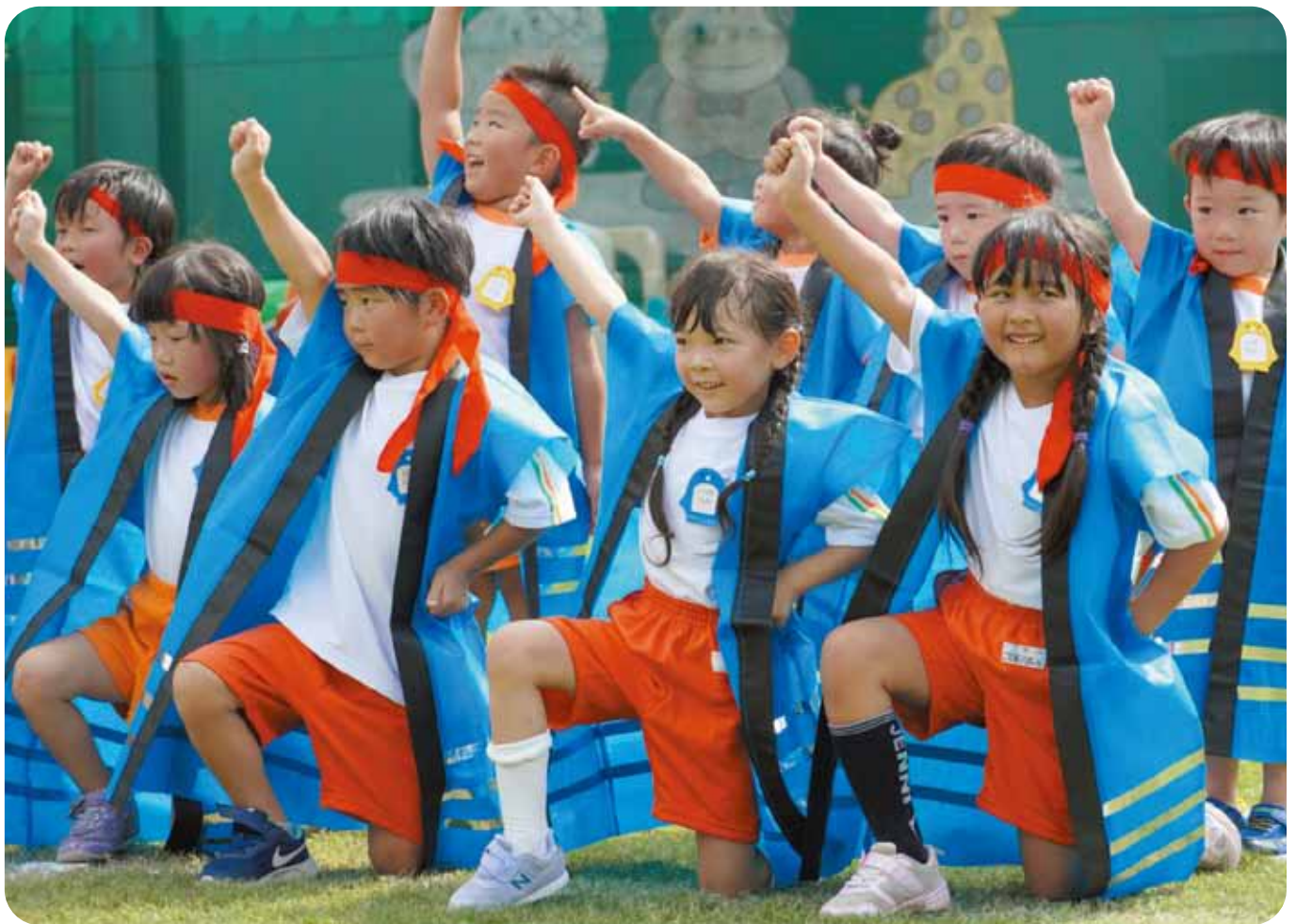
高池保育所 運動会