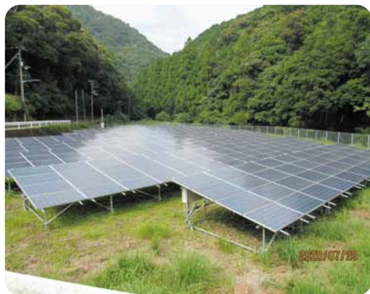
太陽光発電 (三尾川)