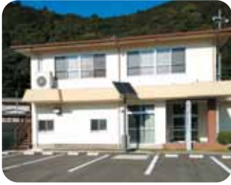
複合センター（高池）